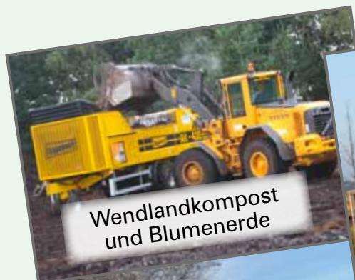
Wendlandkompost und Blumenerde