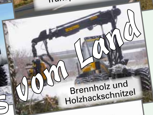
Brennholz und Holzhackschnitzel