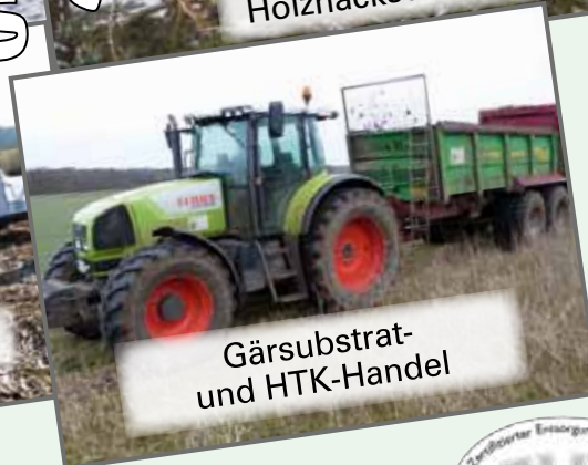
Gärs substrat- und HTK-Handel