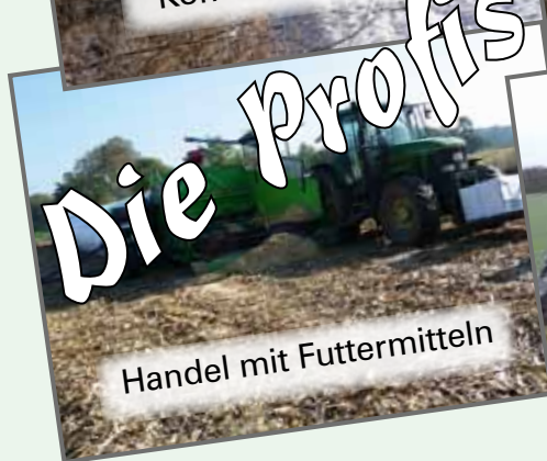
Handel mit Futtermitteln