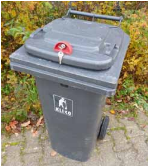
80-Liter Abfallbehälter mit Schwerkraftschloss

Weiter Auskünfte unter Tel: 05841-95112 o. 95117.